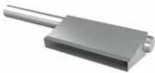
Injection de vapeur