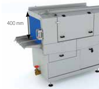
Hauteur de bac surélevée :