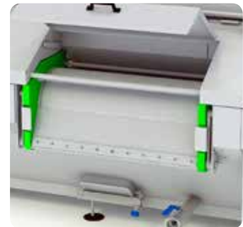
Filtre rotatif à fils métalliques à section tronconique