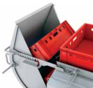
Commande par une seule personne.