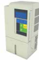
Vitesse de la chaîne de transport réglable au moyen d'un variateur de fréquence