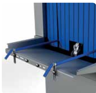
Guides plastiques de bacs