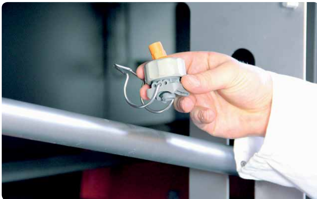
L'EKW-5000, réglage et remplacement de buses aisés.