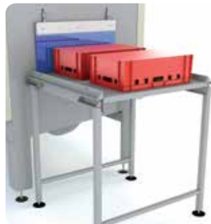
Convoyeurs d'alimentation et de sortie