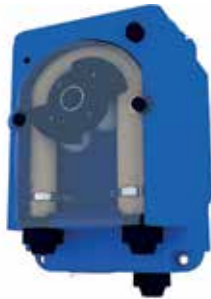
Pompe de dosage pour produit de nettoyage ou de rinçage