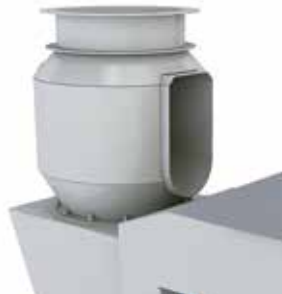
Extraction de vapeur