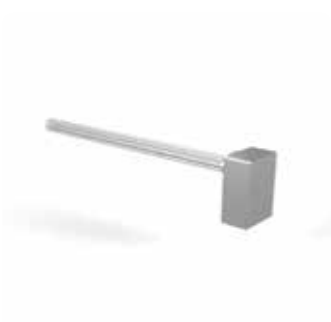
Bruyère après la zone de rinçage