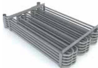
Serpentin à eau chaude