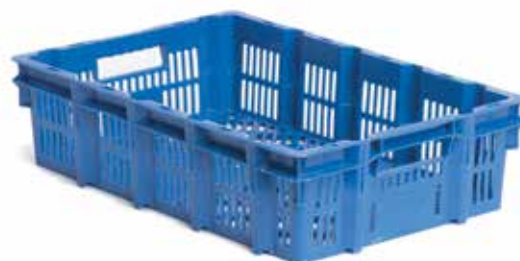
Bac de volailler