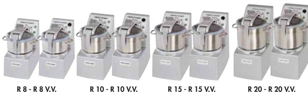
R 8 - R 8 V.V.