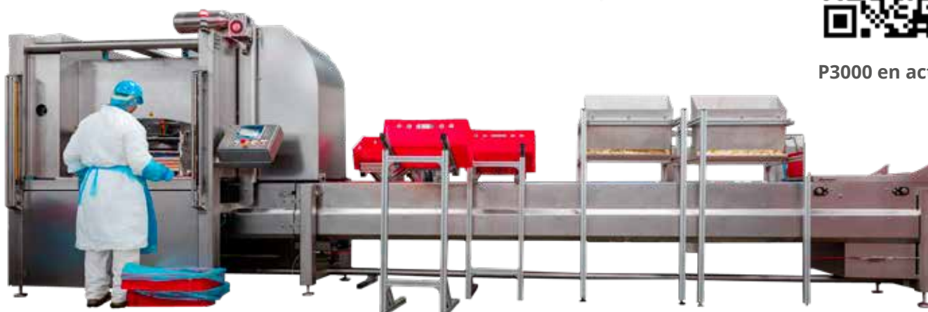
P3000 en action