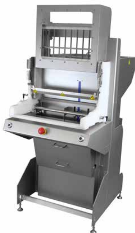
P1000 en action